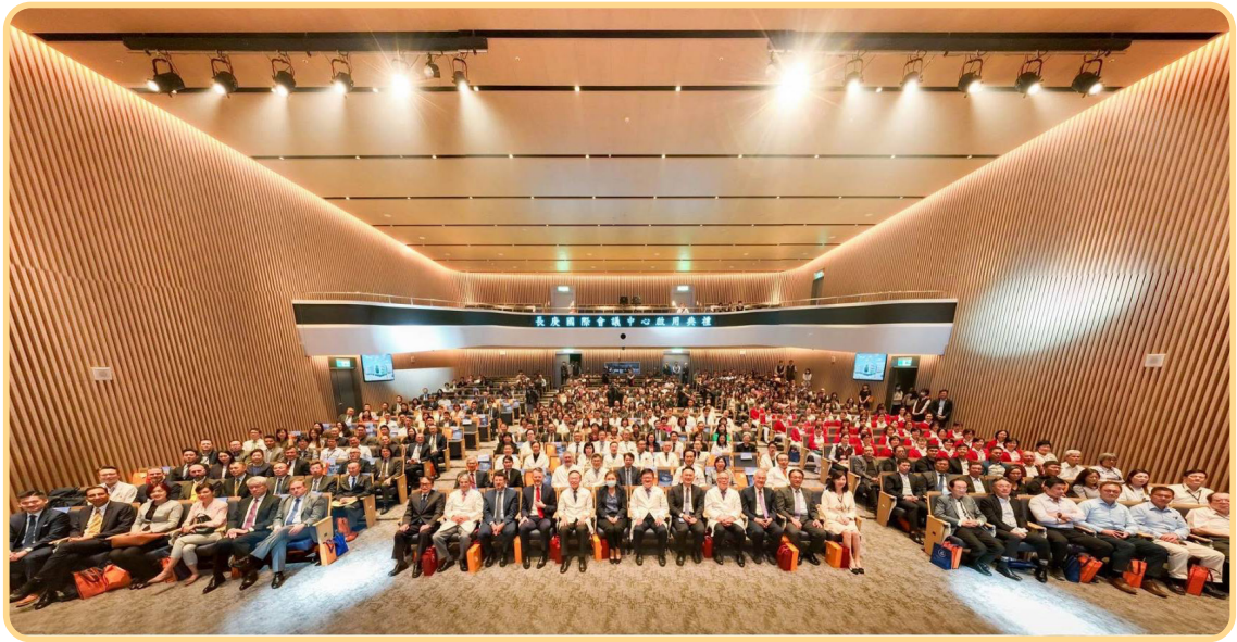
▲ 2023 年長庚醫學週盛大開幕

因地點緊鄰桃園長庚轉運站及長庚湖，會議期間亦可提供與會者多樣化美食饗宴及優美湖畔景觀。在「長庚國際會議中心」3樓梯廳，還矗立一座罕見具大的木化石，為王永慶創辦人生前珍藏的瘿木，至少經歷5萬年以上淬練而成，特別移至此處讓前來參加會議者共賞，並一探其特殊氣場。