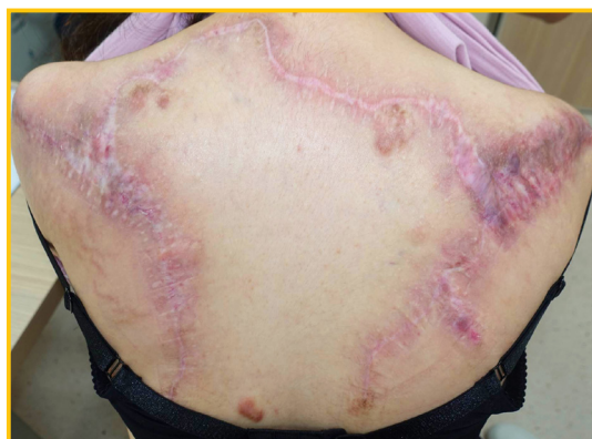
▲陳小姐背部嚴重蟹足腫經基隆長庚醫院手術及放射治療後大幅改善