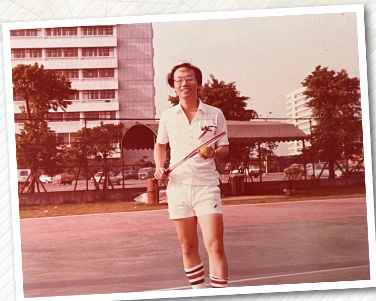
▲ R1 時在林口醫學大樓前打網球留影

笑多於淚，也有苦中作樂，但收穫滿滿：老婆是在長庚追到的，孩子也在長庚出生，許多兒童病友結婚生子，同仁們功成名就……。不過，還是有不少未竟之事，希望繼續和學弟妹們一起努力，期待41年後再來報告成果2.0。👉