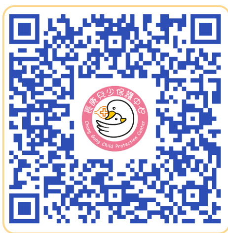
▲掃描 QR code 可觀看動畫影片