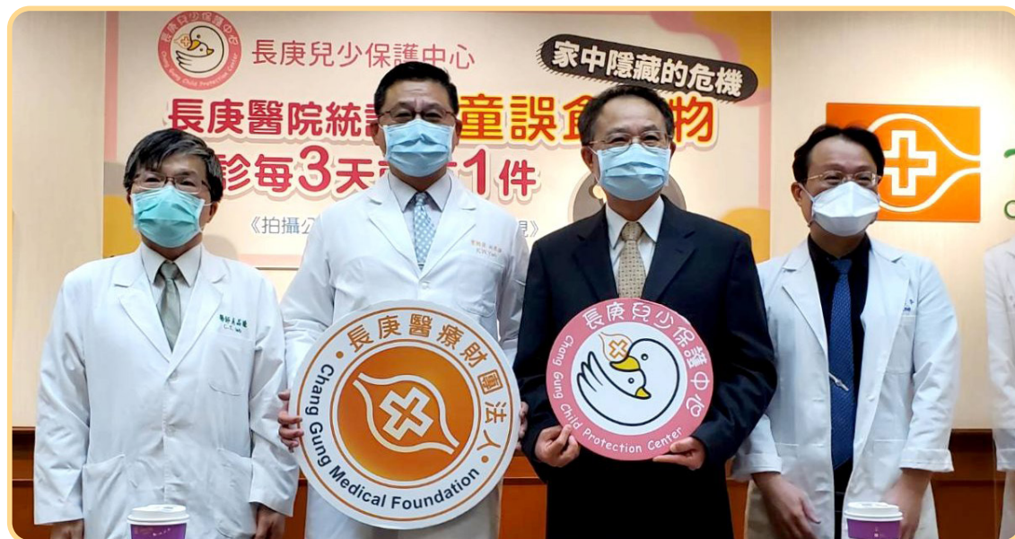
▲長庚兒少保護中心統計孩童誤食毒物急診每3天就有1件，提醒家長重視孩童在家中的安全