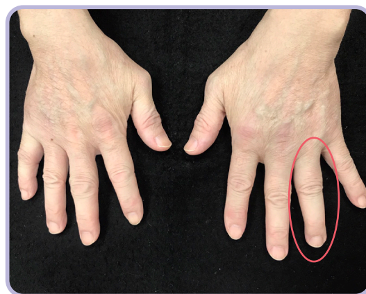
▲類風濕性關節炎導致的手指關節變形

類風濕性關節炎目前仍未有可治癒的藥物，但現今有許多藥物如抗風濕調節藥物等可延緩病情的惡化。由於此病是慢性疾病，儘管治療之後關節腫脹疼痛情況獲得改善，這些藥物還是必須繼續服用不能中斷。而當這些抗風濕調節藥物無法達到緩解病人的症狀時，就可考慮使用生物製劑小分子類的藥物，若抽血發現到發炎指數上升，代表疾病正處於急性活耀的狀態。急性期的狀況下通常會給予類固醇以達到快速控制病情的效果。然而，由於高劑量的類固醇長期使用可能會導致感染或骨質疏鬆症的發生機率上升，一旦達到緩解症狀的目標後，醫師會逐步調降類固醇的使用量以減少副作用的發生。因此，類固醇雖然可能會造成一些副作用，但是若能維持在低劑量下仍是可幫助延緩病情的惡化。