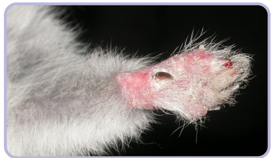
▲兔足部的鬚癬毛癬菌感染