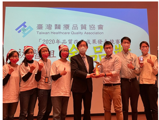
▲榮獲臺灣醫療品質協會競賽「以智能化藥局提升藥事服務品質」金品獎、創新獎

檢驗醫學科提供 24 小時檢驗服務，引進全自動化實驗檢驗和軌道系統，於 6 分鐘內即能將檢體傳送到中央檢驗室，過程完全不需人力傳送與介入，提升檢體傳送效能。