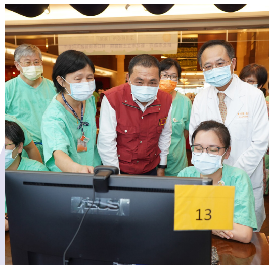
▲土城醫院與林口長庚共同合作齊心抗疫，院長黃璟隆（醫師袍）陪同新北市市長侯友宜（紅背心）視察深坑集中防疫所

後疫情階段，為提供民眾精緻、優質的醫療服務，土城醫院積極申請參加醫院、教學醫院、中度級急救責任醫院等各項評鑑。在醫療技術不斷創新突破下，也提升醫療品質與病人安全，期許提供民眾更有溫度的服務，提倡醫療在地化，土城醫院將秉持為守護新北市市民的健康而努力。✚