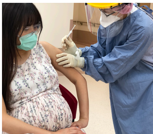
▲提供孕婦友善醫療服務，特開設孕婦疫苗專診

接獲通知後，短短兩天便成立社區篩檢站，為即時找出確診個案，阻斷社區感染源，確保醫療量能。並將三個病房施工改成專責病房，隔出紅黃綠區，負責收治確診病人。打造孕婦友善服務，開設孕婦莫德納疫苗專診，由婦產