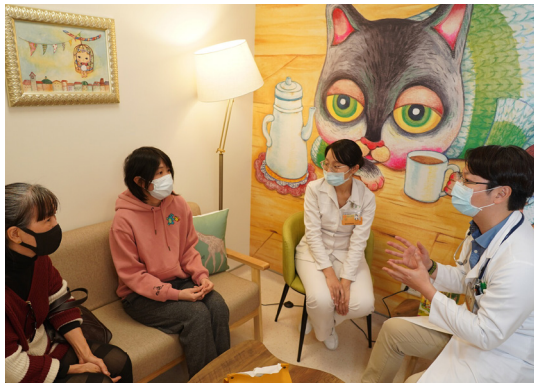
▲心療癒計畫將藝術帶入治療場域，打造出明亮活潑的空間氛圍

癌症中心建立照護獨特性，強化橫向整合跨團隊癌症診療，提供防治及整合性的癌症醫療照護服務。與癌症希望基金會、知名跨界藝術家眼球先生共同合作「心療癒計畫」，將藝術帶入治療場域，打造出明亮活潑的空間氛圍，期望撫慰身心俱疲的癌症病人、家屬以及醫護人員。