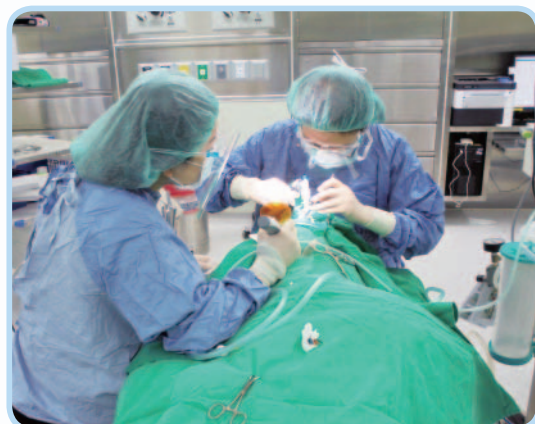
▲圖二：舒眠麻醉及全身麻醉治療讓無法控制、恐懼看牙的患者有新的選擇

牙科服務，希望藉由台北與林口長庚醫學中心牙科的傳承能夠全面開展包括兒童牙科、牙周病科、義齒補綴科、口腔外科、顱顏矯正牙科等業務，並與林口長庚接軌提供一日植牙、一日假牙、顯微牙科與數位補綴矯正治療，使民眾可以得到更完整全面的牙科照護。☎