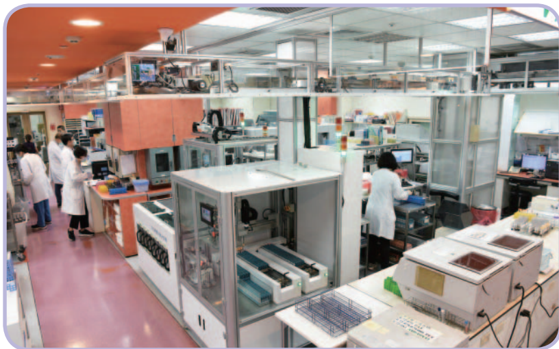
◀ 檢體自動上架、由機器智慧分流，有效提升效率

舉例來說，透過門診預約系統，可以提前知道明天可能有 4 萬個病人要來看病；並且知道哪些人是隔離期間出來的，就轉請他到防疫門診或急診。