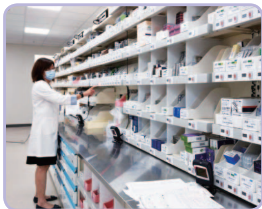
智慧藥櫃能加速藥師確認藥單上的正確藥品

智慧化也能建制早期預警系統跟未來趨勢預測，使醫護人員在狀況發生或變嚴重前，就採取行動。