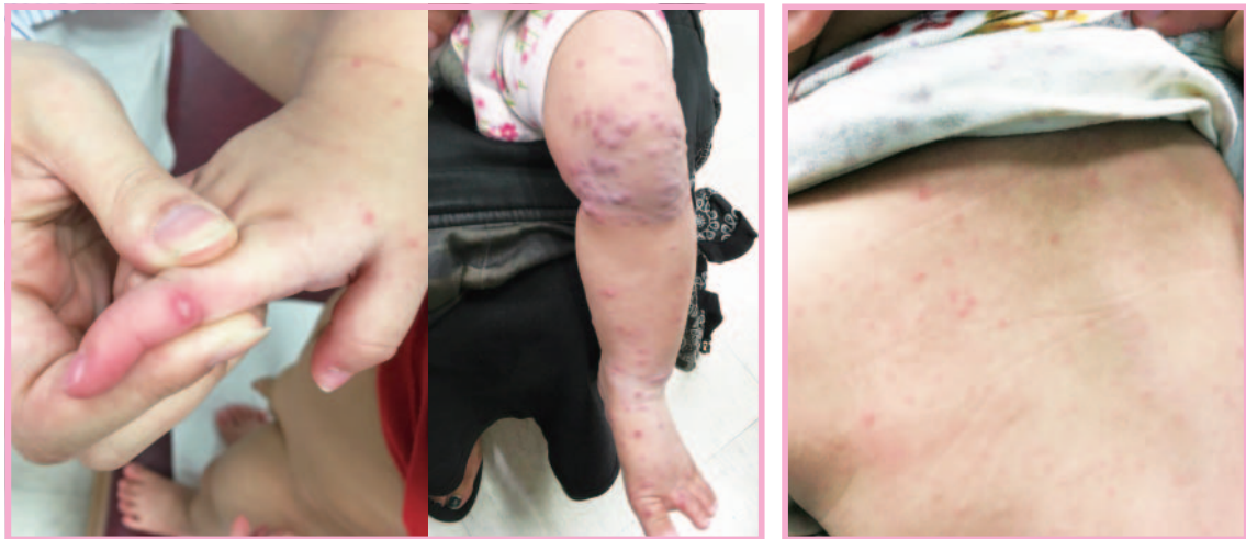
▲腸病毒特徵為身體出現紅疹或水泡，身體的疹子好發於手掌及腳掌