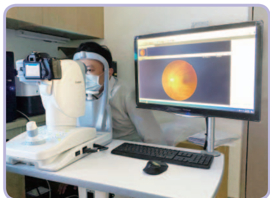
▲圖一：免散瞳糖尿病視網膜檢查