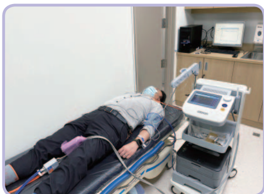
▲圖二：非侵入性動脈硬化篩檢儀