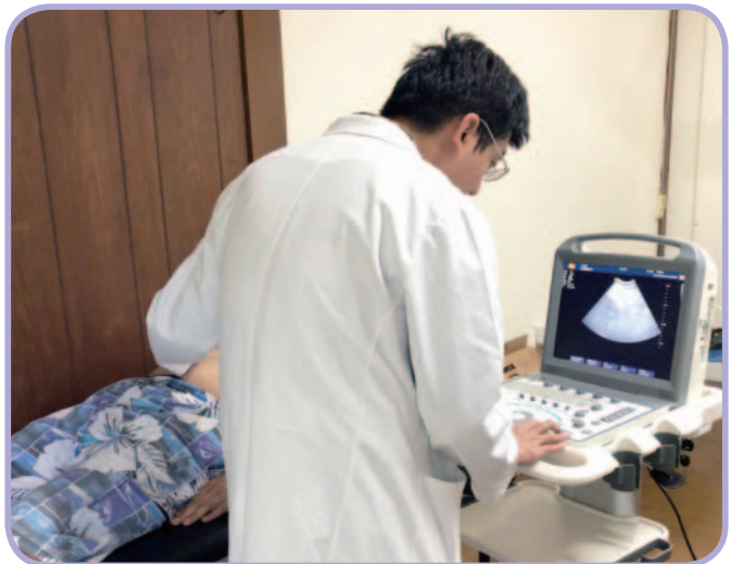
▲胃腸肝膽科醫師執行山區民眾肝臟超音波檢查

從早期急性病診治到後來的專科醫療導入，復興區的醫療已成熟並朝個案健康管理及預防醫學方向邁進，林口長庚將持續配合衛福部健保署「居家醫療」、「遠距醫療」、「肝炎防治」等重大政策，同時善盡社會責任並加強現有服務，為提升復興區山地醫療水準貢獻心力。☞