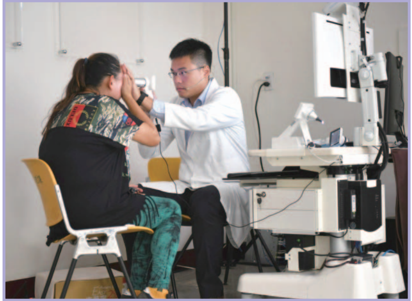
●復興區醫療站醫師操作遠距眼底鏡並將影像連線林口長庚

聖保祿醫院的醫師負責駐診，駐診醫師則由家庭醫學科、內科及其他專科醫師組成，負責提供門診以及 24 小時急診服務。大部分就診問題為上呼吸道感染、腸胃炎、皮膚炎、外傷以及肌肉骨骼疼痛等症狀，較具特異性的求診問題則為蜂螫及毒蛇咬傷，平均每月至醫療站之就診人次