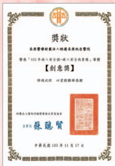
➌ 響應「103 病人安全週—病人安全我會應」榮獲【創意獎】