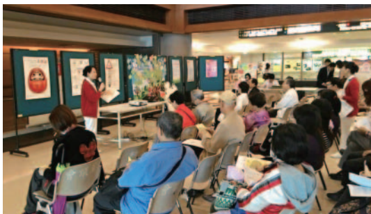
病人安全週宣導暨有獎徵答，民眾響應熱烈

病人安全週響應活動期間，我們特別針對本次推動重點族群及人潮出入多的地點，佈置五處響應專區（醫院大廳、復健治療區、透析中心、及兩區病房入口處），並由專人引導參與響應