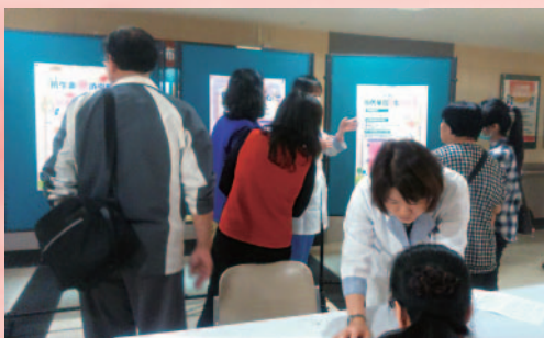
➊ 用藥安全採隨到隨教個別性服務，並透過認知測驗了解正確性