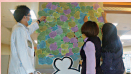
➋ 【病人安全我會「應」】響應專區各類人員均踴躍參與響應