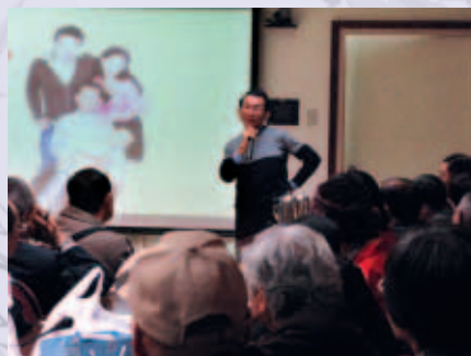
林教授主講的腎友座談會總是吸引滿場的腎友們前來聆聽