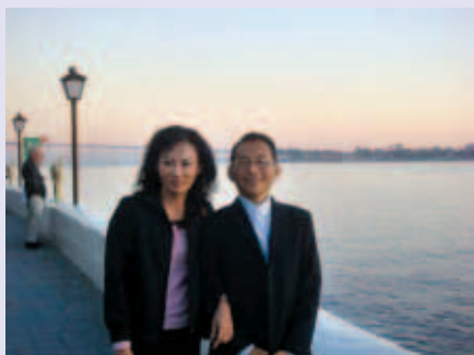
林教授（右）與林太太鶼鶼情深，結婚25年感情依舊歷久彌新，照片攝於2009年美國聖地牙哥