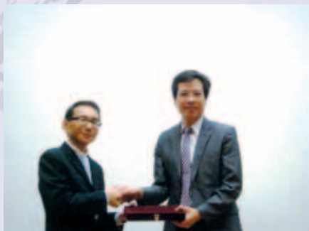
林教授（左）於2012年台灣醫學會，發表巴拉刈除草劑中毒專題演講，獲大會表揚