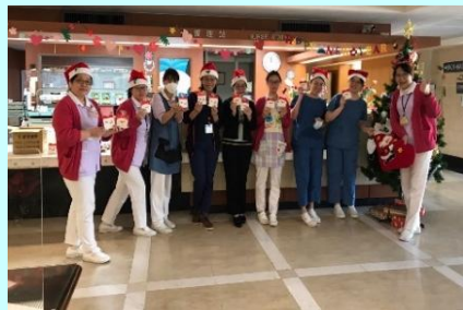
聖誕節活動+園遊會