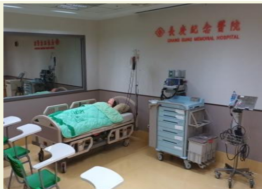
西醫技能模擬學習環境