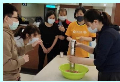
活力闖關健康跟著來