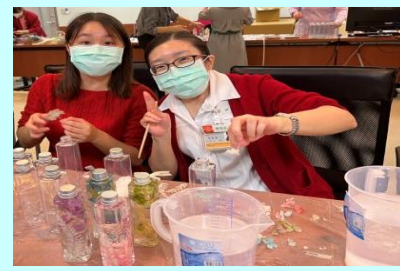
員工紓壓療癒手作活動-浮游花