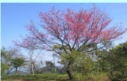
新竹馬武督探索森林健康慢活