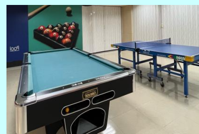
多功能員工文康中心場地寬敞