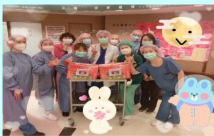
中秋節慶祝活動-柚子趣味競賽活動