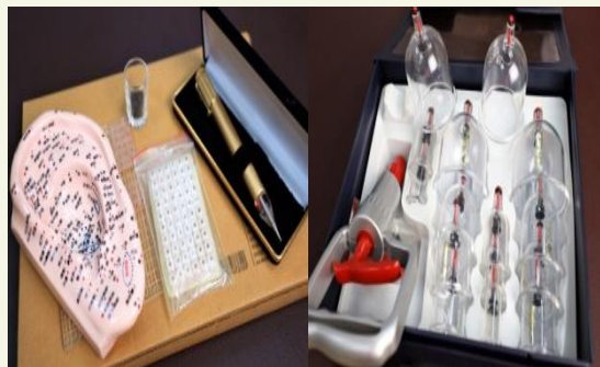
中醫拔罐器、耳穴模擬教具