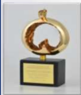
國家生技醫療 品質獎-金獎