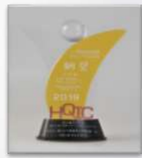
醫策會主題改善 組競賽-銅獎