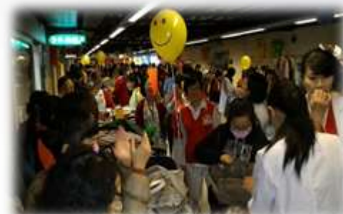
歲末迎新~跳蚤市場