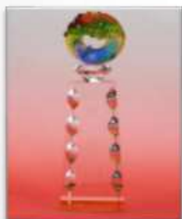
優質護理職 場-銀磁獎