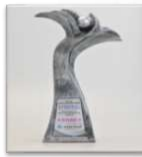
台灣醫療品質 成果發表競賽 -銀品獎